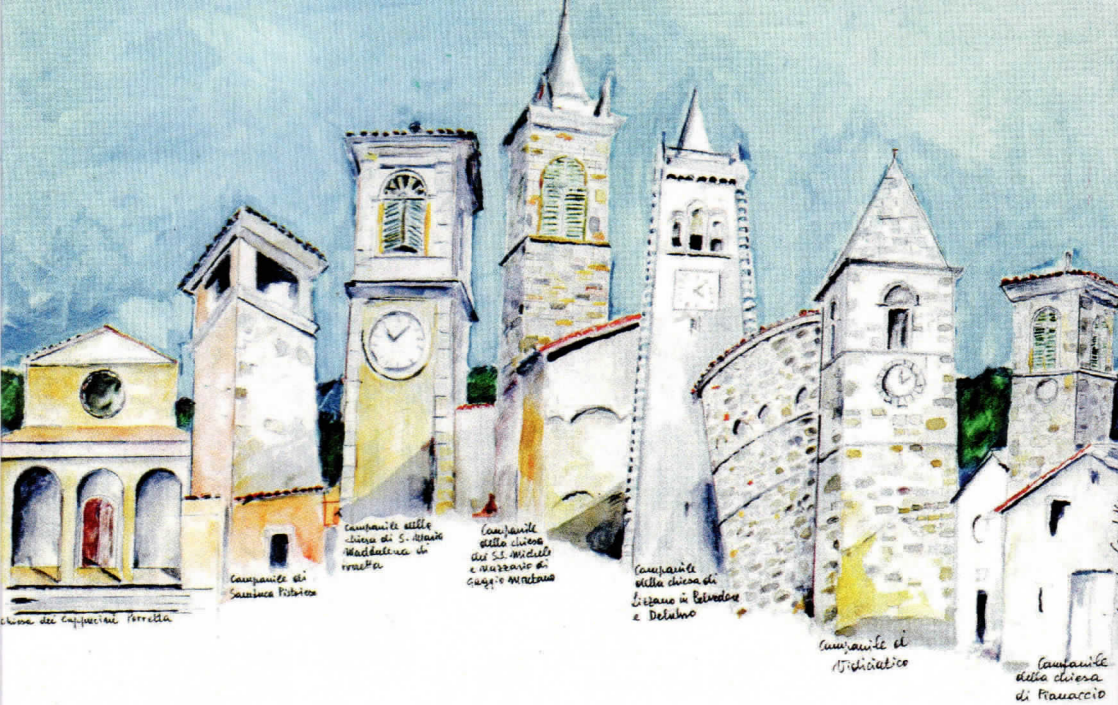
Campanile di Sassina Polenta